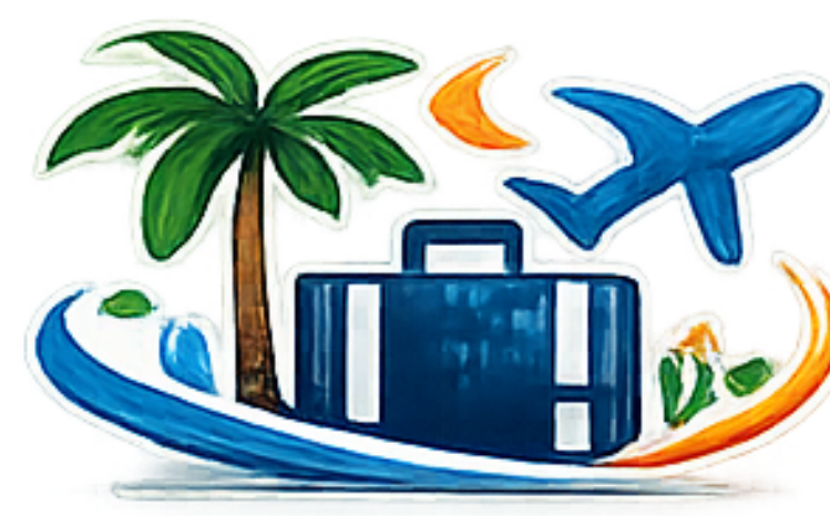
Técnico/a de Turismo