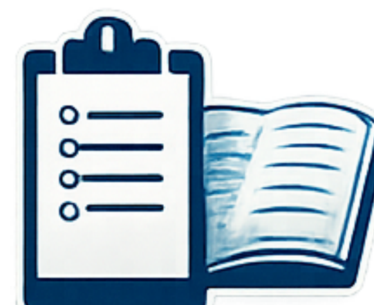
Técnico/a de Secretariado Executivo