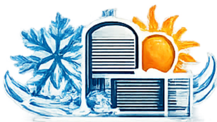
Técnico/a de Refrigeração e Climatização