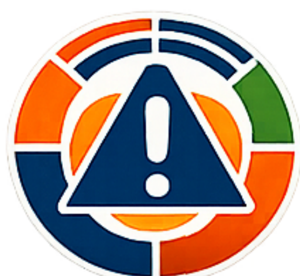
Técnico/a de Proteção Civil