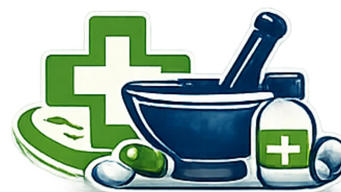
Técnico/a Auxiliar de Farmácia