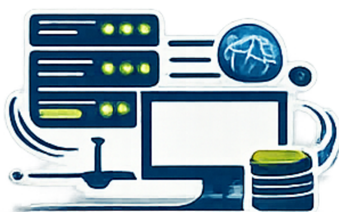
Técnico/a de Sistemas de Computação e Redes